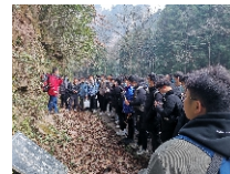
土木专业学生工程地质课程实习