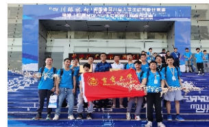
湖南省第八届大学生结构设计竞赛荣获一等奖、二等奖各1项