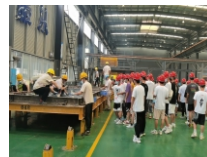
土木工程认知实习