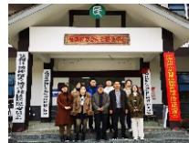
规划专业学生社会实践