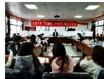
规划专业学生社会实践