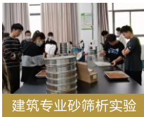
建筑专业砂筛析实验