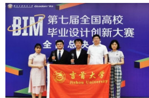
第七届全国高校BIM毕业设计创新大赛一等奖2项