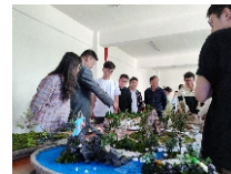
园林专业学生设计作品模型展