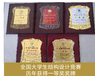
全国大学生结构设计竞赛历年获得一等奖奖牌