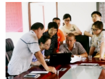
规划专业学生社会实践