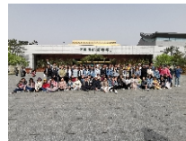
风景园林专业学生专业实习