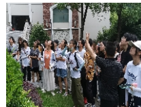
园林植物野外认知实习