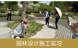
园林设计施工实习