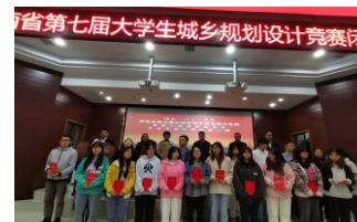
第七届大学生城乡规划设计竞赛学院获一等奖2项、二等奖3项、三等奖3项