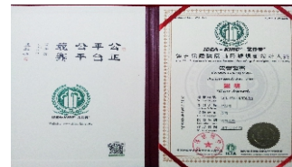
国际园林景观规划设计大赛证书